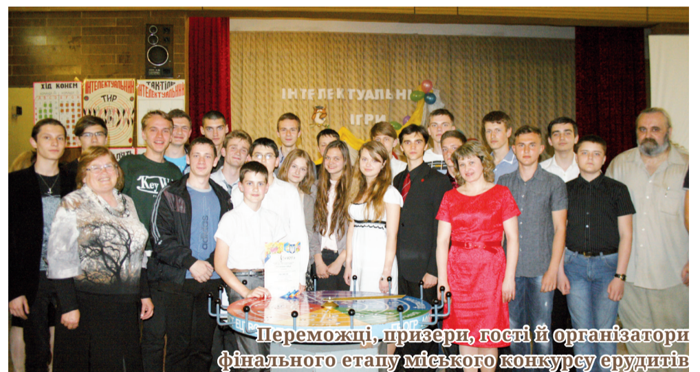
Переможці, призери, гості й організатори фінального етапу міського конкурсу ерудитів

Варто зазначити, що команди фіналістки, за дев'ятимісячний інтелектуальний марафон у рамках чемпіонату провели по 35 ігор, у яких знаходили відповіді і рішення майже на 1000 запитань та завдань різноманітних тематик. Команди грали в основному в авторські інтелектуальні ігри клубу «Ерудит». В арсеналі клубу сьогодні біля п'ятдесяти різноманітних ігор. У фіналі теж використовувалась авторська гра клубу «Веселковий млин», котра дає можливість показати не тільки командну гру, але й індивідуальні знання та ерудицію кожного члена команди. Молоді інтелектуали шукали відповіді на каверзні запитання з